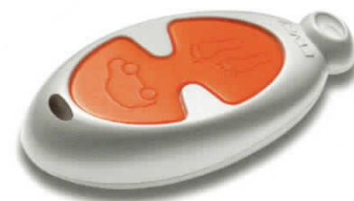
Modello sostituito da EV/ETR5