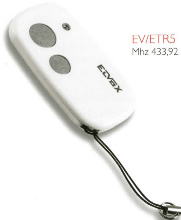
EV/ETR5 Mhz 433,92

Premere e tenere premuto il tasto 12 (P2) sulla centrale e premere e tenere premuto il tasto del radio-comando nuovo, attendere che il lampeggiante emetta un lampeggio a conferma dell'avvenuta memorizzazione, rilasciare il tutto.